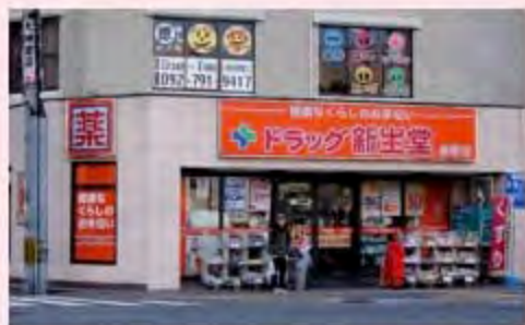
ドラッグ新生堂薬院店