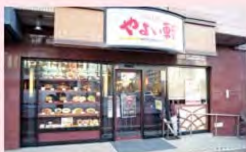
やよい軒渡辺通店