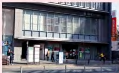
西日本シティ銀行渡辺通支店