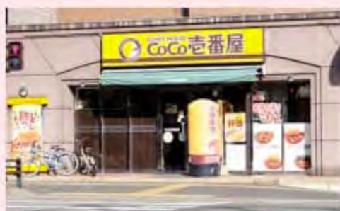
CoCo壱番中央区清川店